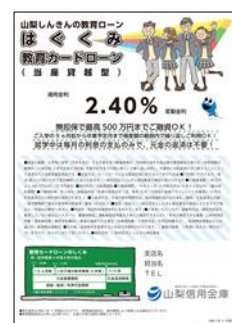
<ひとり親世帯の教育ローン金利優遇>