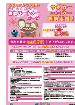
<エコカー、サポカー>