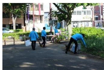
<信用金庫の日 清掃活動>